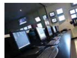
Società di Ricezione eventi