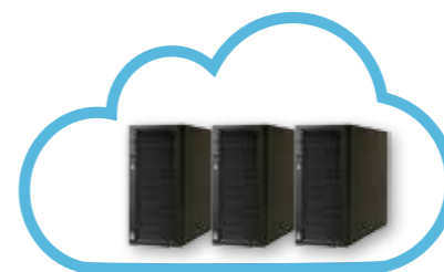
Server Cloud RISCO